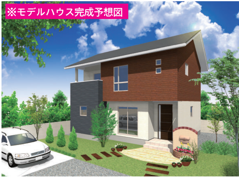
※モデルハウス完成予想図